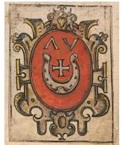
Herb Łada wg Długosza

Wniosek - Jankowo musiało być założone wiele lat wcześniej.