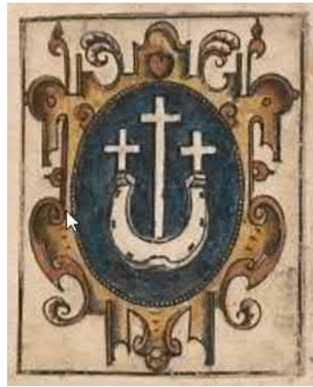
Jeden z trzech herbów Dąbrowa wg Długosza

Jeden z opisów, o tym jak powstawały wsie, zamieszczam na końcu, co w sposób chyba bardzo logiczny potwierdza moją teorię.