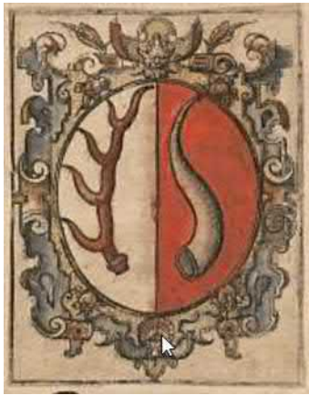
Herb Rogala wg Długosza